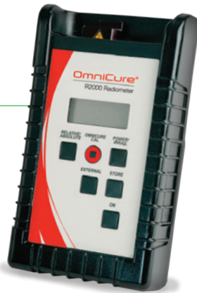
可选配件： OmniCure R2000辐射计

辐照探测是测量紫外线固化系统的光输出，以保持可重复的固化工序的一个必不可少的环节。OmniCure R2000紫外线辐射计可以与OmniCure S1500紫外线固化系统相结合，提供一个具备无与伦比的控制与重复性的完整固化站。